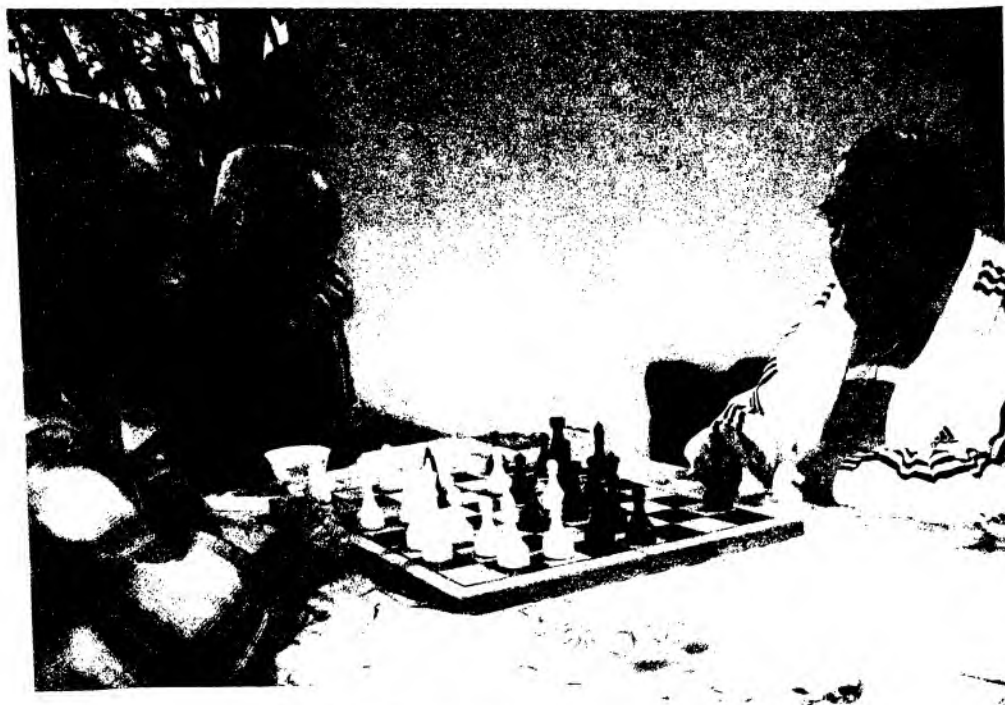
Устоз Эркин Воҳидов билан беллашиш осон эмас.