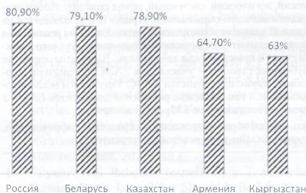
Рис. 2. Доля населения, имеющего широкополосный доступ в Интернет, по странам ЕАЭС

Тем не менее цифровые образовательные инициативы в странах ЕАЭС развиваются, и можно отметить достаточно успешные начинания, например реализуемый с 2019 г. под эгидой ЕС в рамках программы Erasmus+ проект «HiEdTec — Modernisation Of Higher Education In Central Asia Through New Technologies» (далее — HiEdTec), направленный на внедрение и распространение цифровых технологий в университетах государств Средней Азии (Казахстана, Кыргызстана, Таджикистана и Туркменистана) 3 .