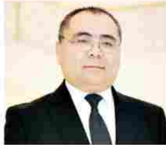
Иброҳим АБДУРАҲМОНОВ, олий таълим, фан ва инновациялар вазири, академик